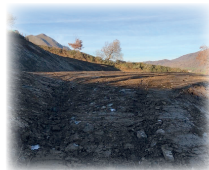
Lieu entreprise forestière Oihan empresa tokia

Gure herriko langileek ahalik eta oberenik egiten dute, ingurunea eta gure osasunaren alde.