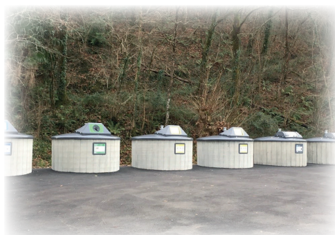
Containers d'Animaenea / Animaeneko hondarkinak

Lurperatuak diren edukiontzia irazgaitzak dira eta fidagarriak, isurtzerik ez dadin gerta, eta, beraz, lurren kutsadurarik ere ez. Ingurumen garbia bermatzen dute, eta estetikoak dira.