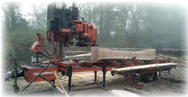
Scierie mobile / Zerrategi mugikorra

Obra-merkatu bat abiatua da ondoko operazioetarako (2021etik 2023ra).