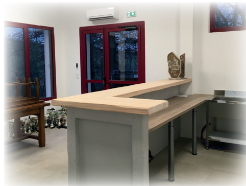
Sarako Izarra Pilota

Pour la construction de cet équipement, nous privilégions des matériaux issus de notre village (pierres, bois de charpente...), il est important pour nous de favoriser un maximum les ressources locales.