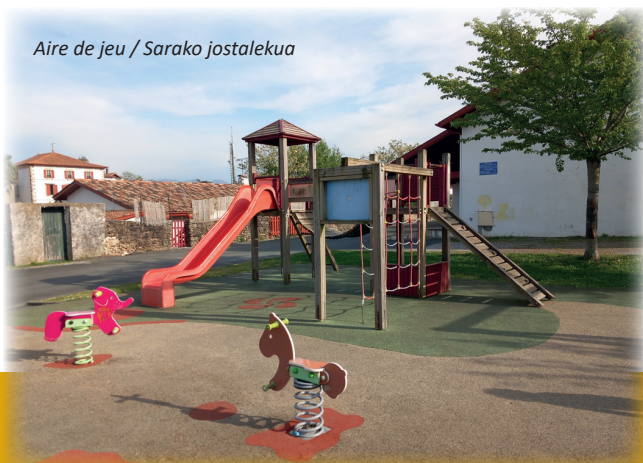
Aire de jeu / Sarako jostalekua

Heldu den sartzearentzat, parametru berri batzuek, bereziki erreserboen ingurukoak, berrikusiak eta pausatua izanen dira.