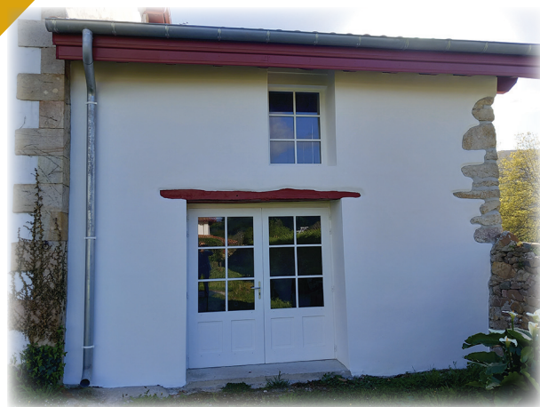
Local stockage costumes Zazpiak Bat / Zazpiak Bat-eko arropen lokala.

Attachée à cette éco-citoyenneté, en collaboration avec la Communauté d'Agglomération Pays Basque, autorité compétente en termes de gestion des déchets, la commune a réaménagé une aire de tri sélectif semi enterré sur la route des Grottes montrant ainsi sa volonté