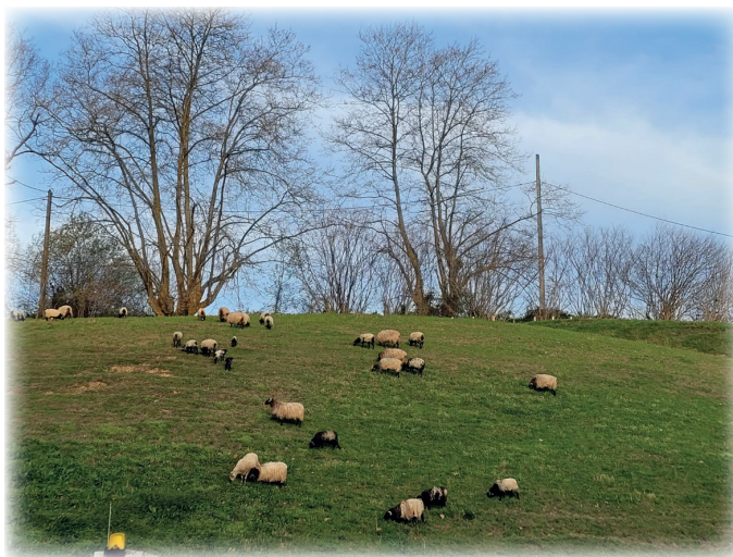
Le bétail / Herriko kabalak