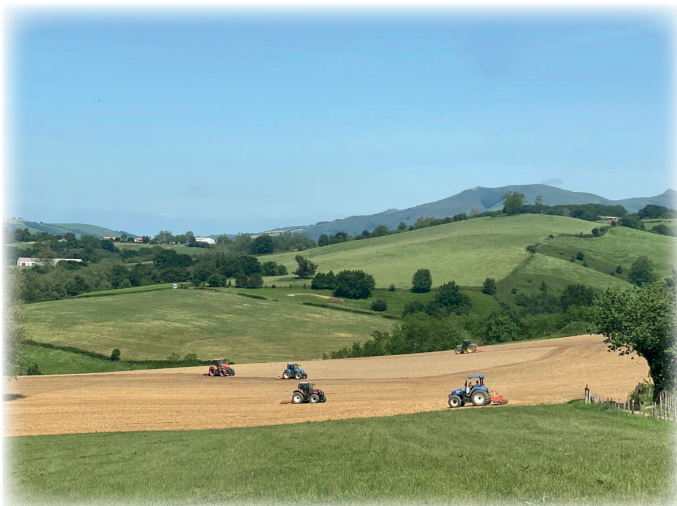
Solidarité au travail / Laborarien elgar laguntza

Le Ravin d'Urrio est un site qui a été équipé par des grimpeurs privés dans les années 1970-1980. En 2012, afin de canaliser la pratique de l'escalade sur ce site, une convention de bon usage avait été signée entre la commune de SARE, l'Association Altxa Elkarte et le CEN Nouvelle-Aquitaine.