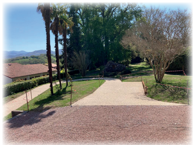
Mise en accessibilité Suharriaga / Suharriagarat sartzte erraztasun lanak

Herriak ez du zerbitzu publiko berezia sortuko eta herri-ekipamendua alokatuko da eskaera egiten duen lurraldeko ehorzketa enpresa orori. Beraz, saratar bakoitzak hautatuko du bere gustuko enpresa.