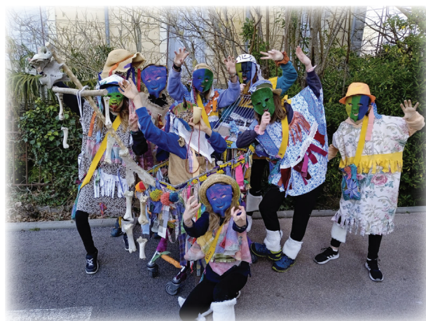
Carnaval / Ihauteriak