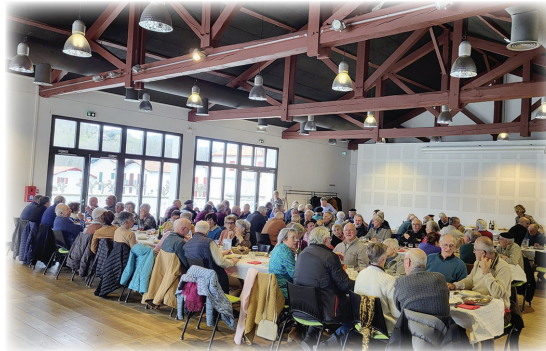
Repas Tripotx / Tripotx bazkaria

duten kideei harrera egiten die, medikuntza tradizionaletik kanpo existitzen diren artatze mota paraleloak eskainiz, presuna bakoitzaren beharrei egokituak arlo fisiko, psikologiko hala sozialean. Helburua da presunen bizi kalitatea mantentzea tratamenduen garaian bai eta ere minbiziaren ondotik, elgarretaratze eta partekatze momentuen eta taller kolektibo hala individual batzuen bitartez.