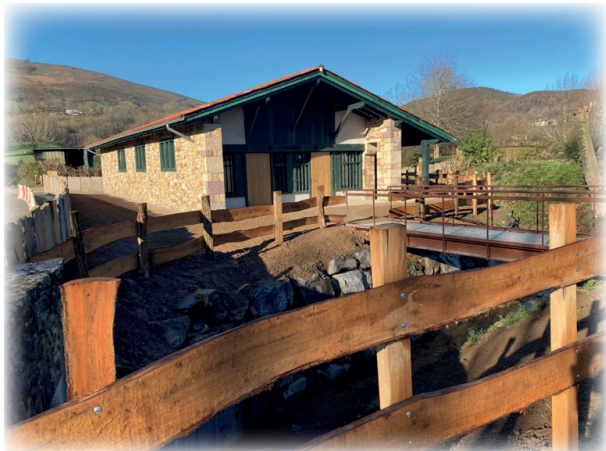
Funerarium / Ehorztetxea