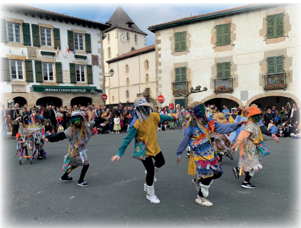
Carnaval / Ihauteriak