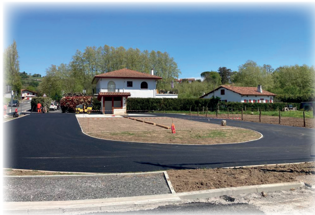
Parking San Pedro / San Pedroko aparkalekua