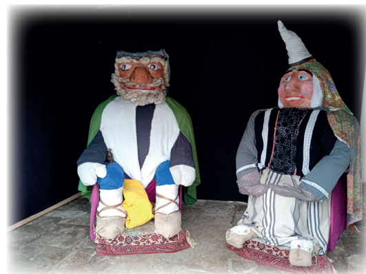
Olentzero eta Mari Domingi