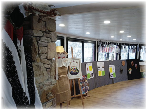
Exposition aux grottes / Erakusketa Lezeetan

Dozena bat musikarik lagundurik, Gaztetxeko gazte talde kopurutsuak « Etxez Etxe »ari hats berri bat eman zion. Jendez beterik egon ziren jantzi eta maska tailerrek Zantantzarren auzia ederki koloreztatu zuten.