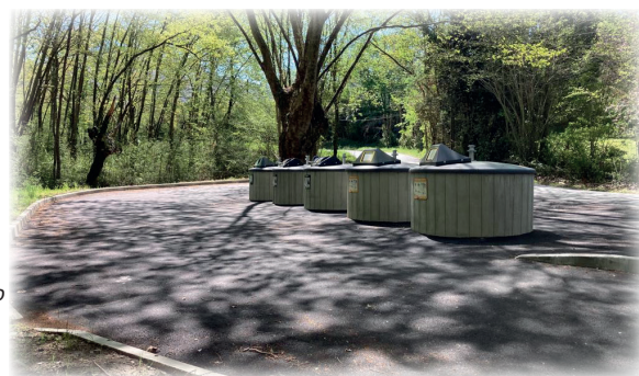
Tri des déchets au quartier des Grottes / Lezeko auzoan zikin bereizte tokia