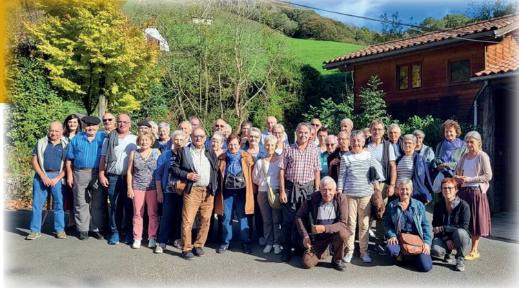
Sortie à Banca / Ateraldia Bankarat

Suite à un don de 2 000 euros, le CCAS a décidé de reverser l'intégralité de cette somme à la maison Goxa Leku située entre Saint-Pée-sur-Nivelle et Saint-Jean-de-Luz,