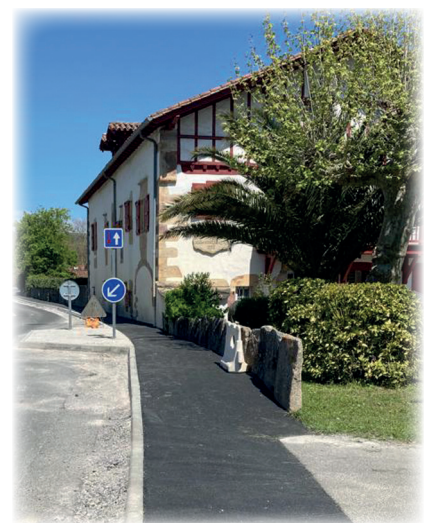
Aménagement RD306 entre Portua et Animainea / Portua eta Animainea arteko errepedearen antolamendua

Herriko Etxeak segitzen du herriko elkarten sostengatzen eta laguntzen diru-laguntzak emanez, gelak, egoitzak, materiala eta langileak eskura utziz ekitaldien antolaketaren kariatara.