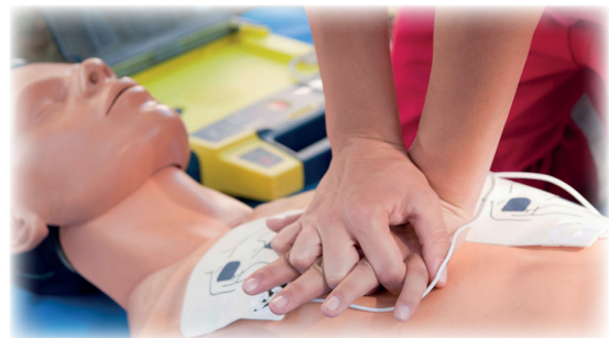
Formation aux 1 ers secours / Lehen sokorriak ikasteko formakuntza

2022ko larrazkenean egun osoko bi formakuntza saio antolatu ziren; saio bakoitzean hamar pertsonak parte har zezakeen gehienez. Hemeretzi pertsonak segitu dute formakuntza.