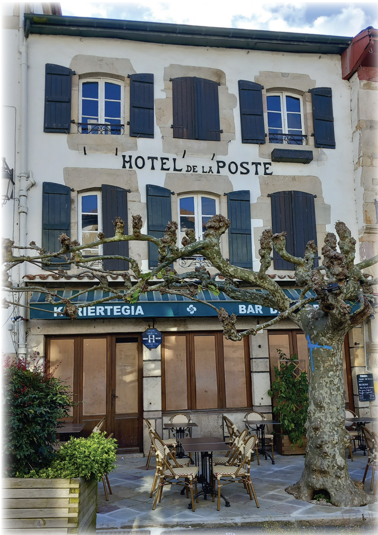
Hôtel de la Poste / Kuriertegia