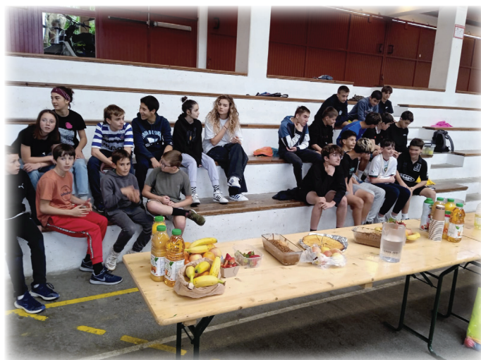
Regroupement d'ados / Gaztetxoan topaketa

Apiril hontan, Senpereko gazteek, Sarako gazteei zango baloi txapelketa eta elbarritu kirolen sentiberatzea bat proposatuko diete. Iniziatiba ederra !