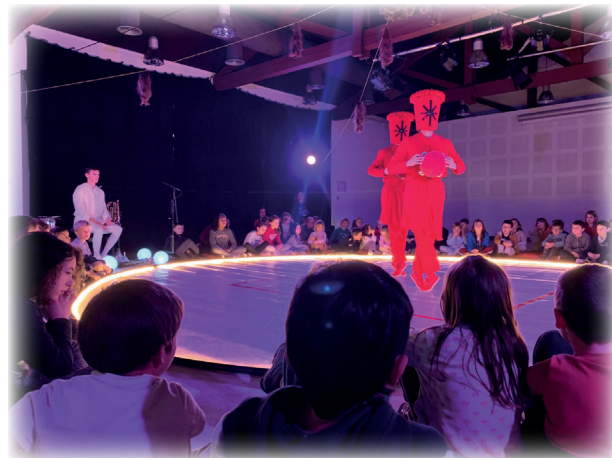
Bilaka Taldea Saran

MILESKER HAUNDI bat parte hartu duten laguntzaile eta elkarte guzietan ! Zuek gabe ezingo ziren antolatu momentu zoragarri guzietan horiek.